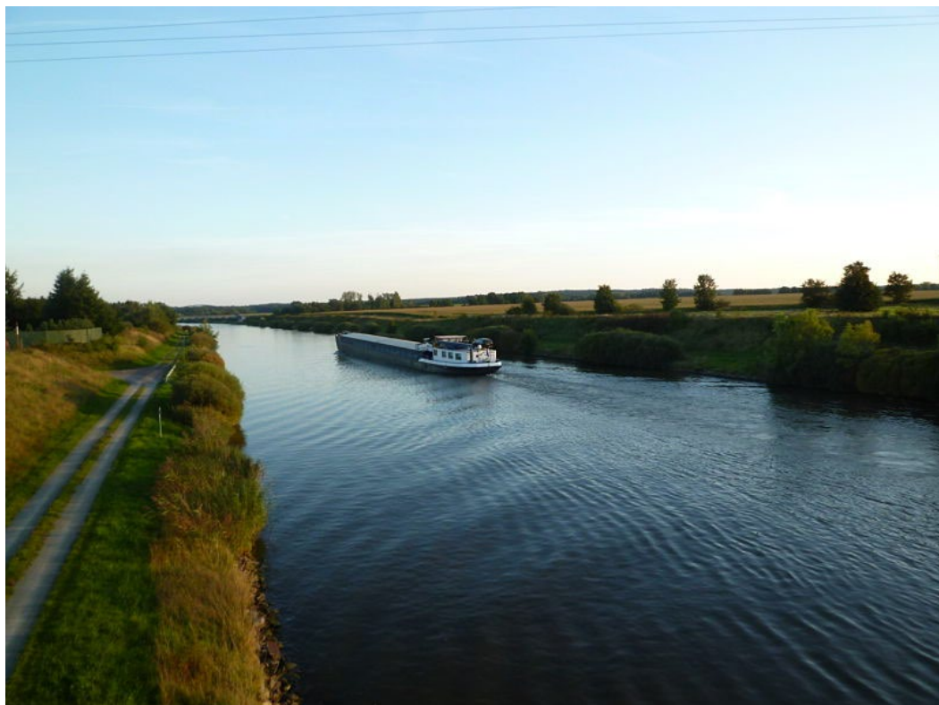
Abb. 1 Mittellandkanal bei Calvörde